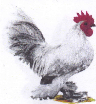
1-0 gris perle caillouté blanc